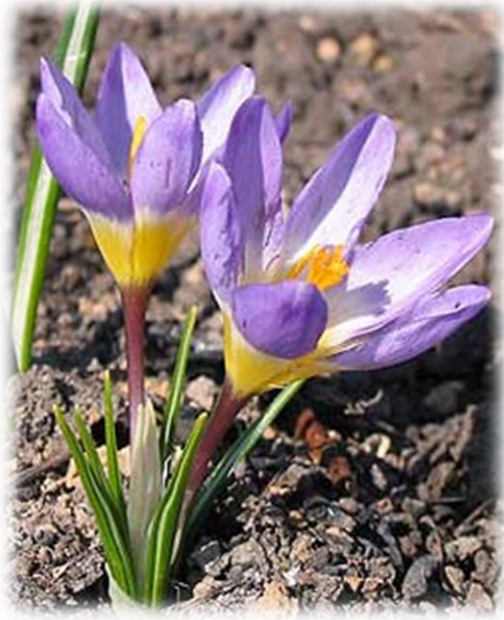
Адамијев шафран ( Crocus adami Gay)