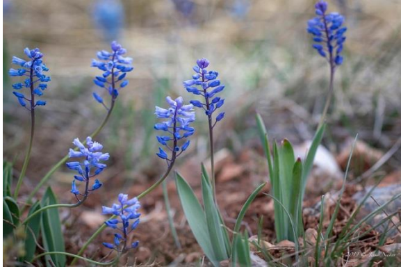
Румелијски зумбул ( Hyacinthella leucophaea (Stev.)