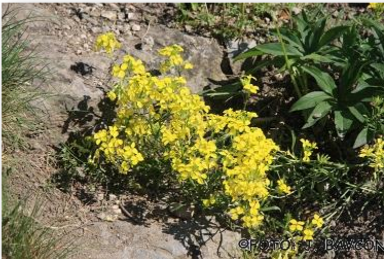
Праменаст трижаль ( Erysimum comatum )