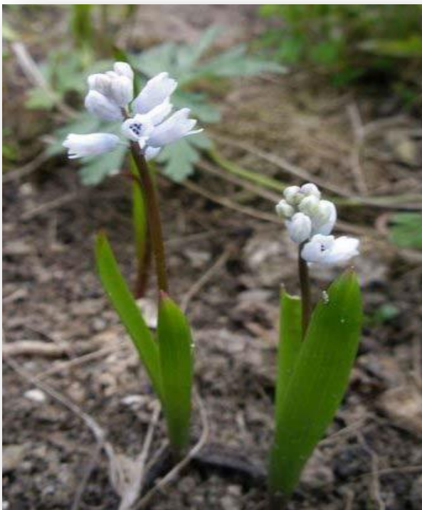
Балкански звончић ( Campanula velebitica Borb.)