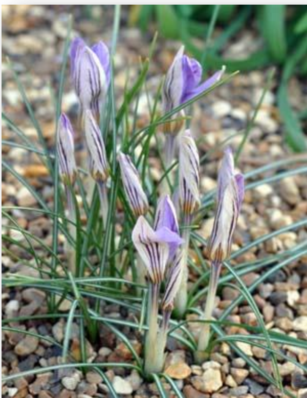
Хибридни шафран ( C. hybridus Petrović)