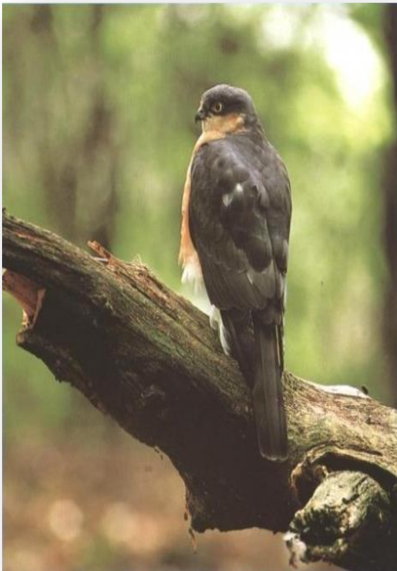
Риђи соко ( Buteo rufinus Cretz.)