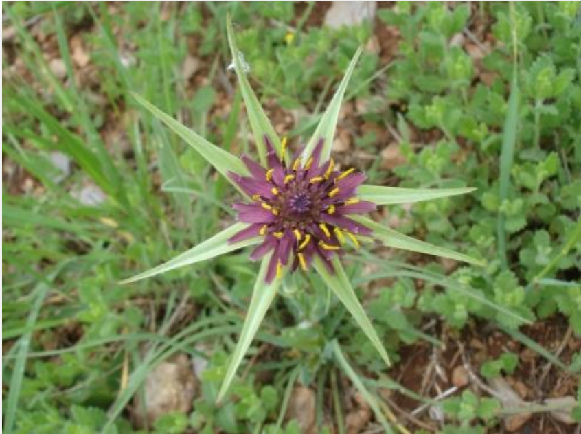
Балканска козја брада ( Tragopogon balcanicus )