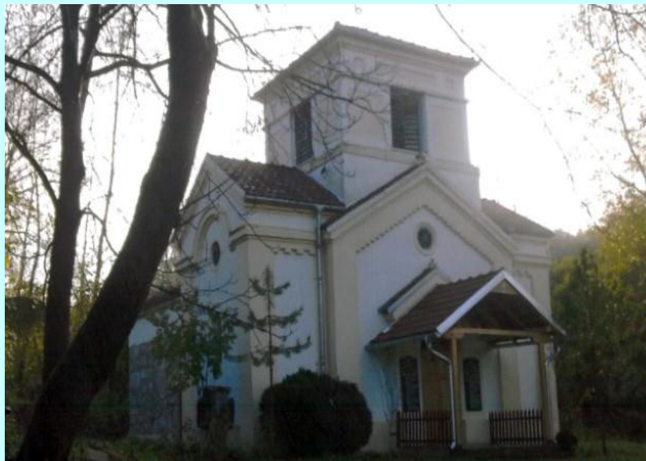
Црква Св. Димитрија Пасјача