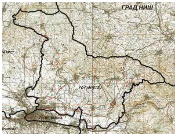
Слика 1: Положај Града Ниша у Републици Србији

Површина Градске општине Пантелеј износи 14.176,36 и 62 м 2 , а број становника, по најсвежијим подацима Завода за статистику у Нишу из 2021. године је 52.209.